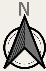
Схема інженерної підготовки, благоустрою території та вертикального планування М 1:1000